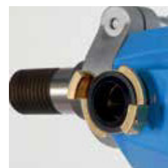
Conversione rapida tra carotaggio a umido e a secco con DME20PU***