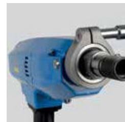
Design compatto ed ergonomico