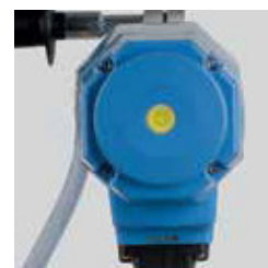
Indicatore di potenza e manutenzione e guida di livellamento